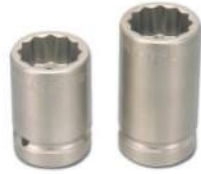
8NR-33 / 8NR-33L