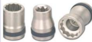
8NR-33B / 8NR-21B / 8NR-4121B