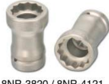
8NR-3820 / 8NR-4121