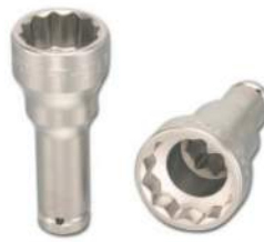
4PT-33 / 4PT-4121