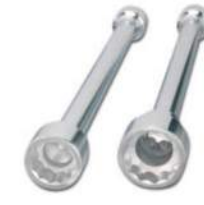
8ST-33 / 8ST-4121