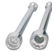
6ST-33 / 6ST-4121