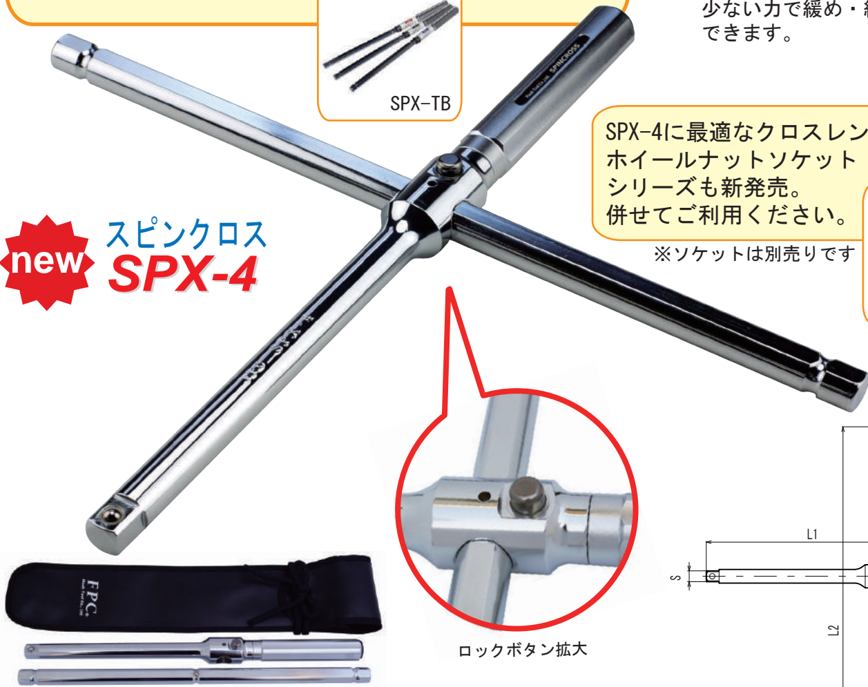
ロックボタン拡大