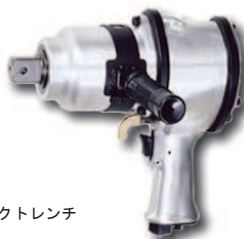
インパクトレンチ